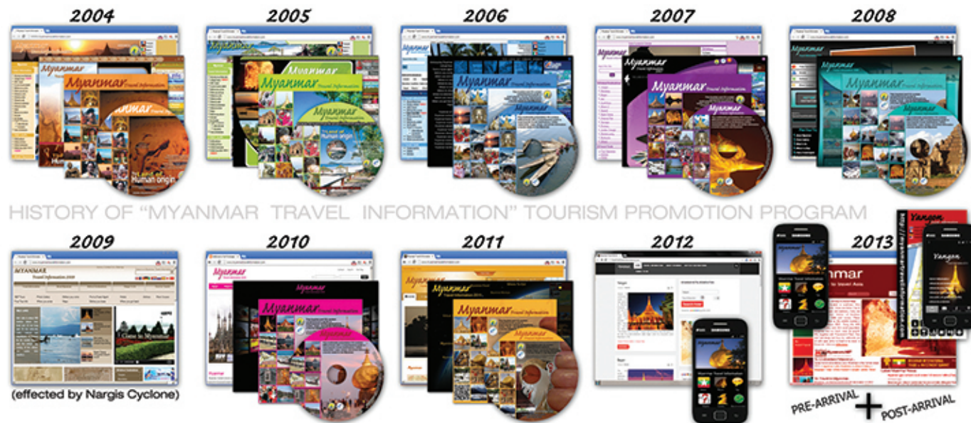
HISTORY OF "MYANMAR TRAVEL INFORMATION" TOURISM PROMOTION PROGRAM

မြန်မာ့အင်တာနက် Myanmar Travel Information magazine mm 3/1 Myanmar Info Tech Campus, myanmars.net 11052, Yangon, Myanmar